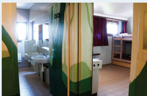
salle de bain + chambre